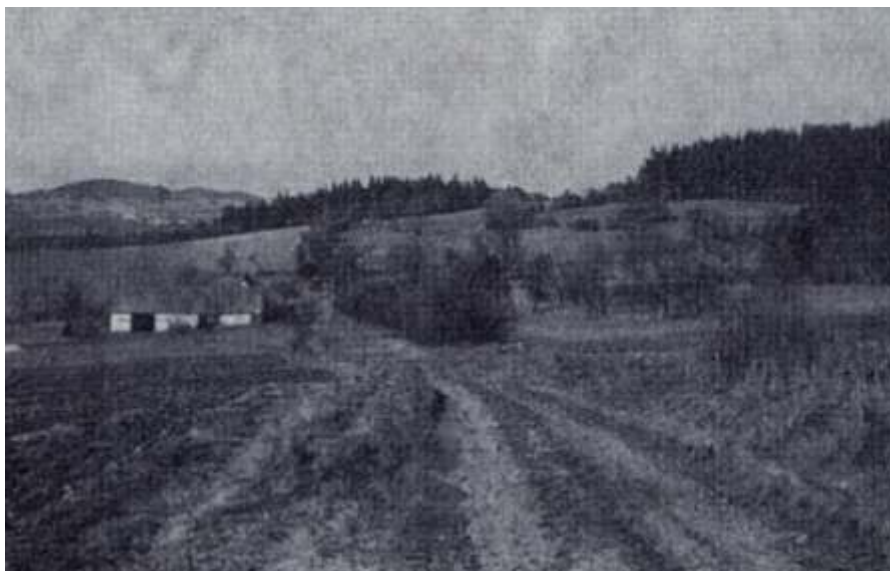
Nedochovaný snímek Ktišky s usedlostí čp. 8 a 9 (Kohoutí Kříž)