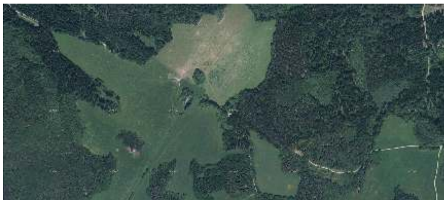
Ktiška, stelní snímek 2011

zmínka se datuje k roku 1387. Jednalo se o vesnici ležící v nadmořské výšce 850 m.n.m. Po vrcholy Ktišské hory (911 m.n.m) a Mackova vrchu (904 m.n.m.) V roce 1930 se zde nacházelo celkem 8 domů a 60 obyvatel. V roce 1946 bylo odsunuto celkem 48 obyvatel. Vysídlená vesnice byla v roce 1957 fyzicky zlikvidována, přičemž se zachovala jen jedna usedlost.