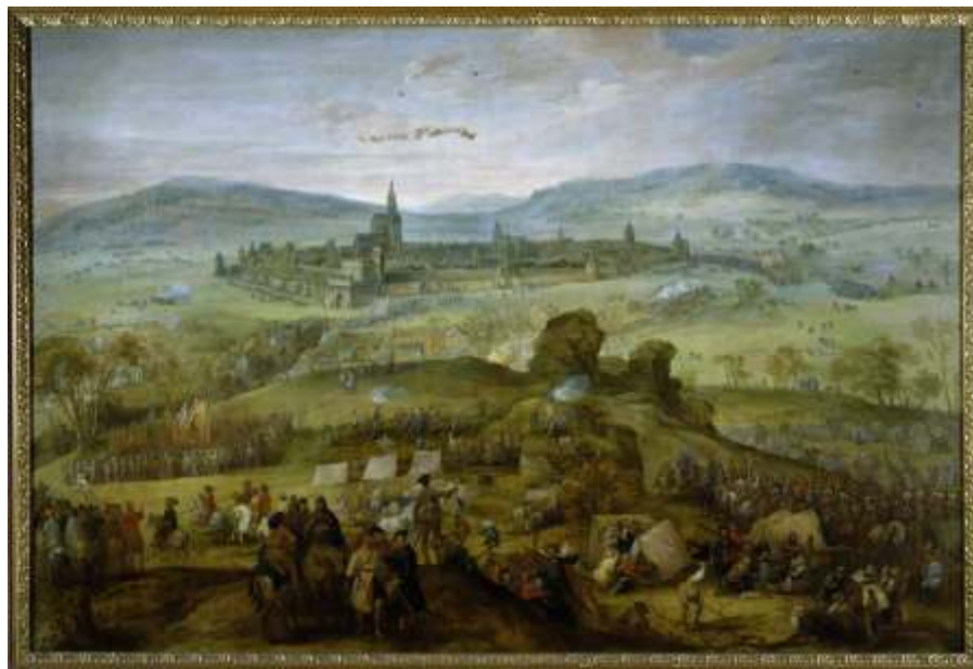
Pieter Snayers: Obléhání Prachatic 1619, olejomalba na plátně

dělem z třicetileté války. Návštěvníci výstavy byli slovem a obrazem seznámeni s třicetiletou válkou jako celoevropským vojenským konfliktem, který předurčil podobu Evropy na následující stáletí a který výrazně zasáhl do dějin našich zemí. Dozvěděli se také o polních opevněních z této války na našem území i v okolních oblastech a o výzkumech, které na některých z nich proběhly v průběhu uplynulých několika desetiletí. Zvláštní pozornost výstava věnovala zmíněným Volarským šancím, o které se v letech 1618 - 1620 několikrát bojovalo a které sehrály významnou úlohu ve vojenském