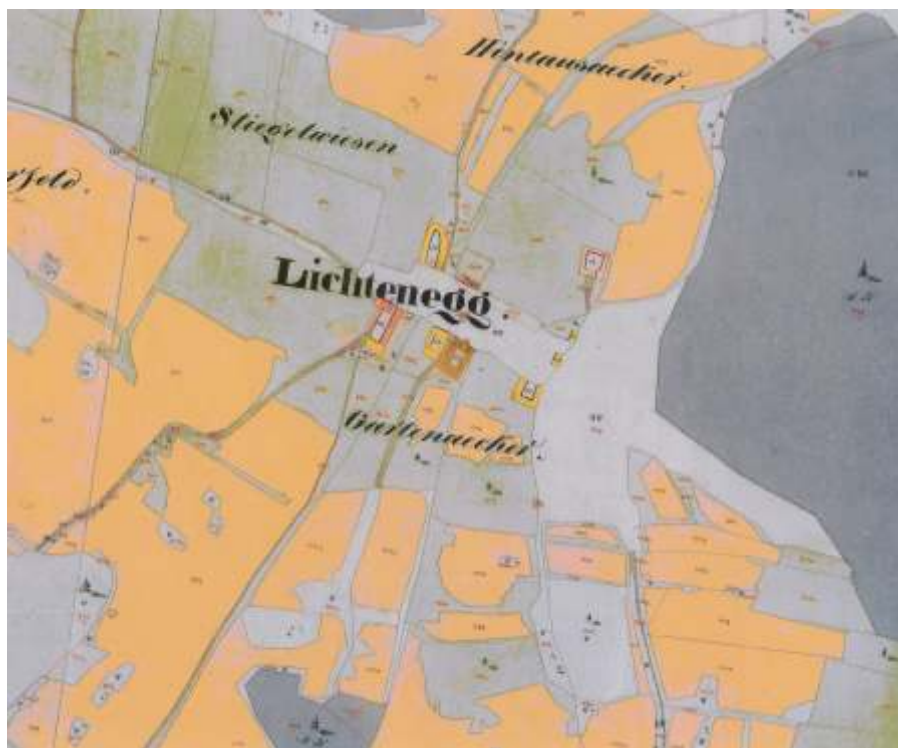
Ktiška, stelní katstr 1826 (obec Ktiš)

zmínka se datuje k roku 1387. Jednalo se o vesnici ležící v nadmořské výšce 850 m.n.m. Po vrcholy Ktišské hory (911 m.n.m) a Mackova vrchu (904 m.n.m.) V roce 1930 se zde nacházelo celkem 8 domů a 60 obyvatel. V roce 1946 bylo odsunuto celkem 48 obyvatel. Vysídlená vesnice byla v roce 1957 fyzicky zlikvidována, přičemž se zachovala jen jedna usedlost.