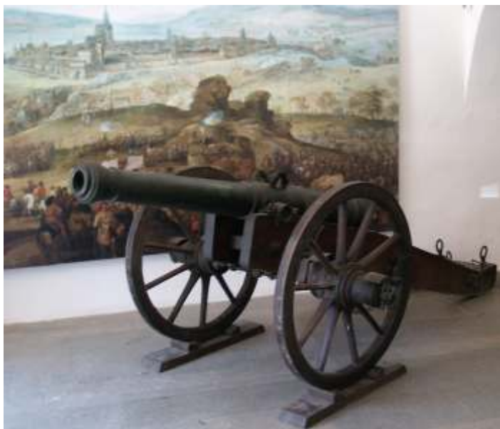
Dělo z roku 1644 ze zámku v Českém Krumlově

Prachatické muzeum připravilo na letní sezónu 2019 autorskou výstavu, která představila fenomén polních vojenských opevnění z doby tricetileté války a zároveň reagovala na probíhající 400. výročí povstání stavů Království českého proti Habsburkům. Jedno z nejvýznamnějších polních opevnění z té doby, tzv. Volarské šance, se zachovalo nedaleko Prachatic, u přechodu přes Teplou Vltavu u Soumarského mostu. Toto opevnění bylo již několikrát předmětem vědeckého výzkumu a pochází odtud jeden z největších a nejcennějších souborů nálezů militárií z tricetileté války. Nálezy a výzkum Volarských šancí se staly jádrem této výstavy a doplnily je nálezy z jiných podobných opevnění v Čechách a originální zbraně a vojenské náležitosti a doplňky z doby tricetileté války (mušketa, opěrná vidlice muškety, tzv. furketa, jezdecká pistole s kolečkovým zámkem, jezdecký palaš, kord, halapartny, přilby typů marion a pappenheim, součásti kyrysnické zbroje atd.) ze sbírek jiných muzeí a památkových objektů (Národní památkový ústav v Českých Budějovicích - státní zámky Český Krumlov a Hluboká, Jihočeské muzeum v Českých Budějovicích). Výstavu oživil model Volarských šancí a maketa části těchto šancí s originálním