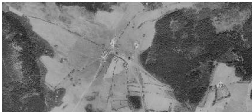
Ktiška, letecký snímek 1952 (kontaminace.cenia.cz)

Zaniklá vesnice Ktiška byla založena ve druhé polovině 14. století kolonizační činností mnichů ze Zlatokorunského kláštera. První písemná