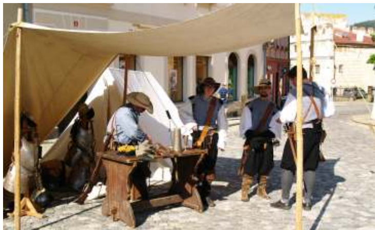
Ležení šermířské skupiny Berit