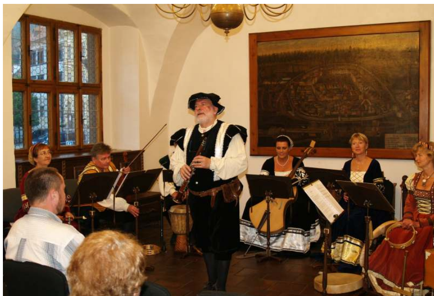
Koncert souboru Chairé v renesančním sále