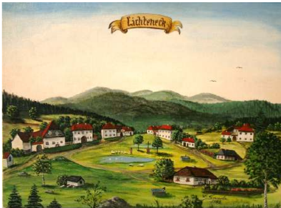
Jediná dochovaná podoba Ktišky od W. Sanda, 1988

Zaniklá vesnice Ktiška byla založena ve druhé polovině 14. století kolonizační činností mnichů ze Zlatokorunského kláštera. První písemná