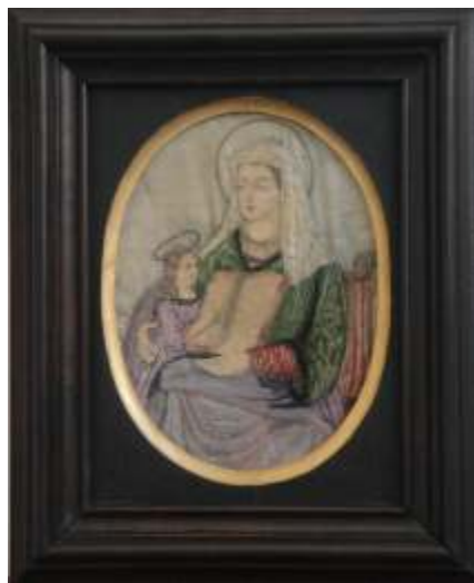
Stav po konzervaci