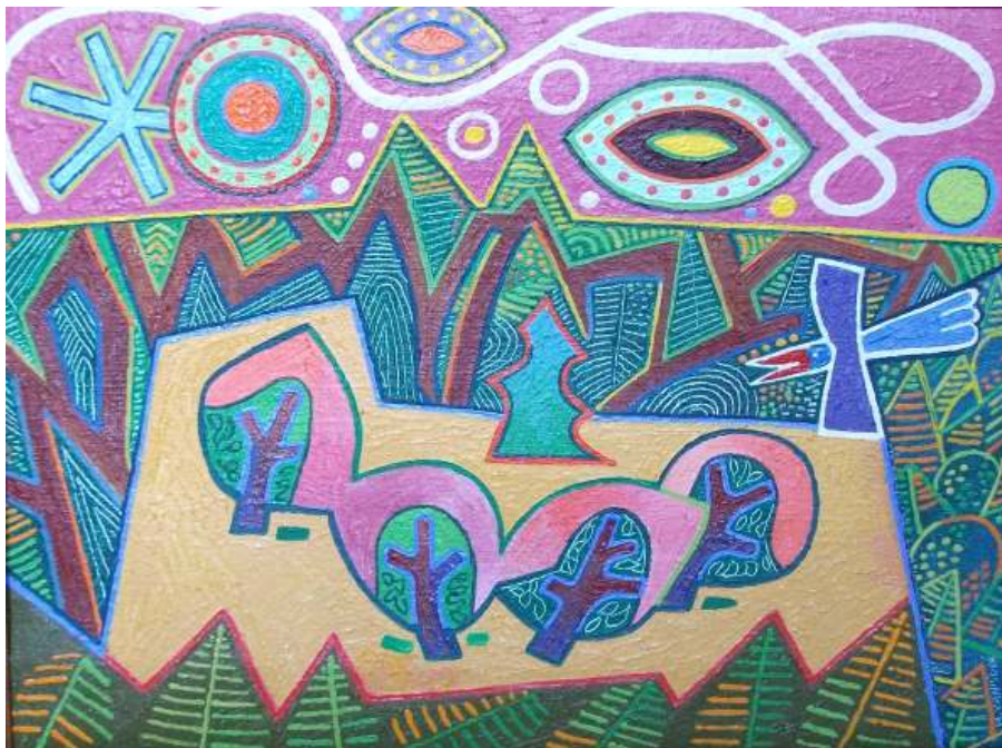
Krajina (olej/plátno) 1999