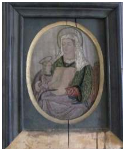
Stav před konzervací

byly odstraněny prachové nečistoty. Zteněné hedvábí bylo podloženo krepelinou a zařazováno. Rámek byl vytmelen, uvolněné části byly přiklizeny a po citlivé retuši povrch upraven. Při závěrečné kompletaci byla výšivka překryta sklem.