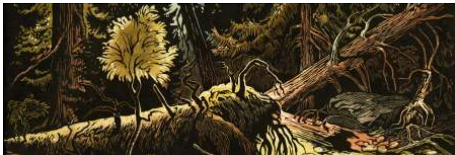
Šumavský prales (barevný dřevoryt) - detail

jakýmsi zrcadlem mých obrazů, mé mysli. Jsem zároveň spokojen, že v době, kdy pro velké podzimní sychravé deště, i v zimě, nemohu vyjít ti za svou prací, mohu přikrýt pod stěnou a v teple tvořit divočinu ostrých a energických vzrůstů v kombinaci s bohatostí ryzího vedení. Barvy jsou úsporné starozákonní a šumavské k tomu. Myslím si, že jsem se konečně dopracoval k technice, která plně, spolu s mými obrazy, dotváří obraz duše toho, mnou tolik milovaného kraje.”