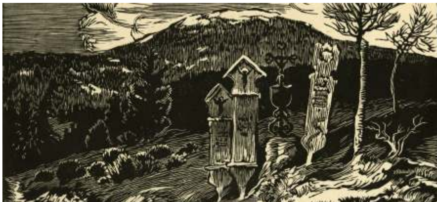
Umrl í prkna (d evoryt)

Letos na ja e si p ipomínáme dvojí výro í malí e a grafika Josefa Krejsy. Uplynulo 115 let od jeho narození (14. 3. 1896 Husinec) a 70 let od úmrtí (21. 4. 1941 Husinec). V depozitá i muzea je spravována sbírka jeho díla obsahující