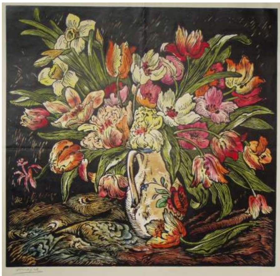
E-VUG-86 Kytice jarních květ (barevný dřevoryt)

olejomalby, kvaše, tempery, akvarely, kresby a grafiky. Nejpočetnější je soubor grafik - dřevoryt.