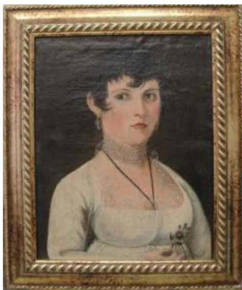
Stav po dokončení restaurování

Plátno bylo silně ušpiněné, potrháné a proděravělé. Barevná vrstva byla na mnoha místech odpadaná a stávající uvolněná od podkladu. Po sejmutí plátna z desky byly nečistoty a prach odstraněny štětcem. Byla zafixována barevná vrstva k podkladu tak, aby neodpadávala a mohla být čištěna rozpouštědly. Rentoláž plátna byla provedena lokálně u proděravělých a potrháných míst. Plátnem byly také podloženy okraje s dostatečným přesahem, z důvodu poškození a snadného přichycení plátna k desce. Chybějící a odpadaná místa barevné vrstvy byla doplněna a vytmelena. Poté byla provedena rekonstrukce malby v místech perlového náhrdelníku a téměř chybějící pravé ruky. Retuše byly provedeny tak, aby korespondovaly s původní barevností. Na závěr byla provedena povrchová úprava a připevnění plátna na dřevěnou desku. Obraz byl vsazen do nového rámu.