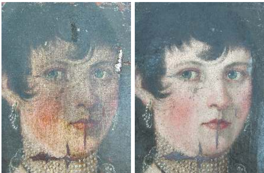
Stav v průběhu restaurování