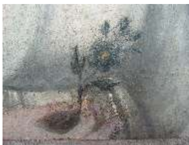
Detail ruky po restaurování