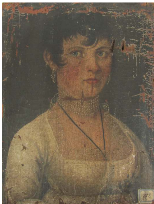
Stav před restaurováním