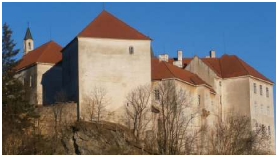
VI kova v ž

Václav VI ek získal zkušenosti na v tšín tehdejších bojiš st ední Evropy a snad se zú astnil i dlouhé války Polska s ádem n meckých rytí v polovin 15. století. Postupn se vypracoval ve velmi schopného velitele eských námezdných žoldné a s nimi se dal najímat do služeb t ch mocipán , kte í dob e platili. asto m nil strany a n kdy vál il i proti tomu,