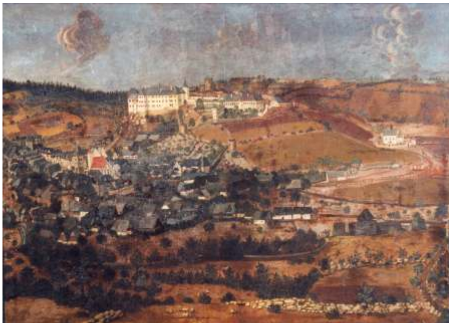
Vimperk kolem roku 1670

nedovoloval totiž velkorysejší stavební podnikání a moderní sídliště proto vznikla stranou a idylickému obrázku starého Vimperka neublížila. Z p vodního vimperského hradu se v rámci dnešního zámku zachovalo n kolik stavebních částí a p edevším tzv. VI kova v ž. O tomto VI kovi, který jí dal jméno, si dnes povíme.