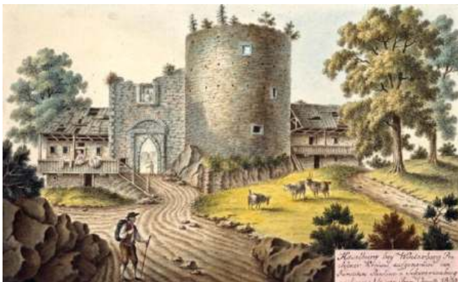
Haselburg v roce 1809

Václav VI ek získal zkušenosti na v tšín tehdejších bojiš st ední Evropy a snad se zú astnil i dlouhé války Polska s ádem n meckých rytí v polovin 15. století. Postupn se vypracoval ve velmi schopného velitele eských námezdných žoldné a s nimi se dal najímat do služeb t ch mocipán , kte í dob e platili. asto m nil strany a n kdy vál il i proti tomu,