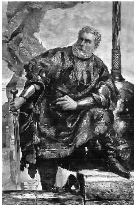
Jan Matijka: Václav VI. (detail obrazu)

v jehož službách byl ještě před nedávnem. Největší slávu však získal ve službách krále Jiřího za války proti koalici nepřítelů na sklonku jeho vlády. Vyznamenal se především hrdinskou obranou Tebeic proti vojsku uherského krále Matyáše v roce 1468. Dlouhá léta také sloužil římskému králi Fridrichu III. a nástupci krále Jiřího Vladislavu Jagellonskému. Svému emeslu však rozuměl i v době před rokem 1468. Svému emeslu však rozuměl i v době před rokem 1468. Svému emeslu však rozuměl i v době před rokem 1468. Svému emeslu však rozuměl i v době před rokem 1468.