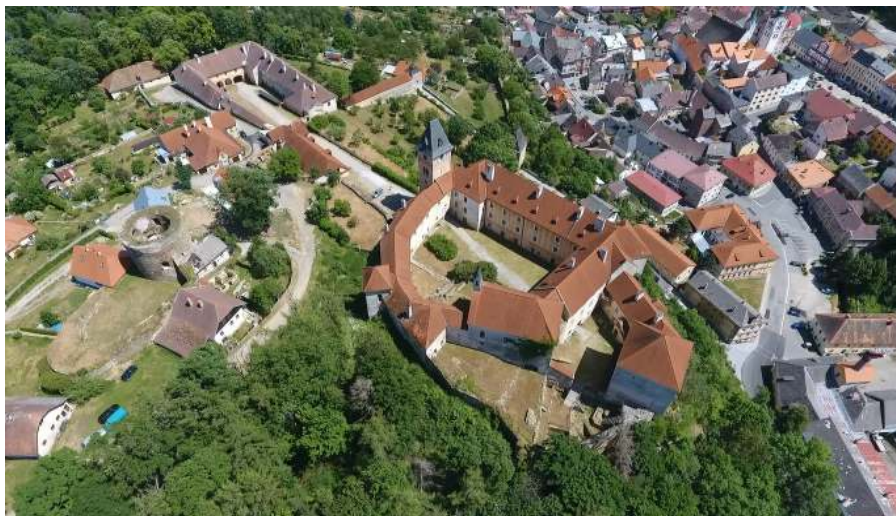
Vimperký zámek dnes