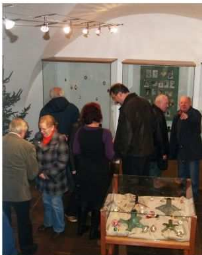
Duch Vánoc v Prachatickém muzeu