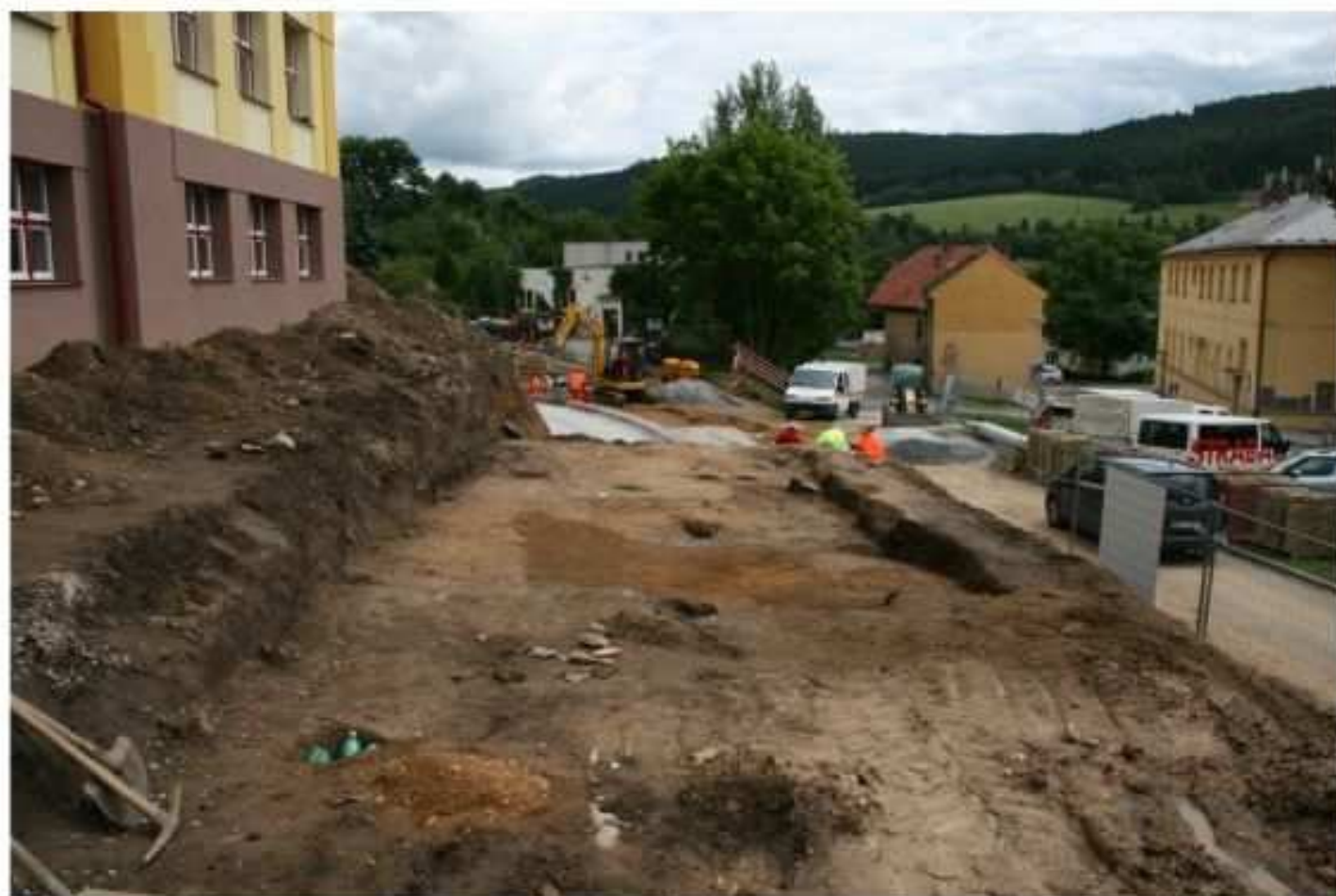
Prachatice. Výzkum pozůstatků osady z raného a počátků vrcholného středověku u Vodňanské školy v Prachaticích.

V roce 2012, kdy slaví Prachatice 700 let od první písemné zmínky, se naskytla unikátní příležitost k ověření stručné zprávy Bedřicha Dubského o existenci osady z raného středověku v místech současné základní školy ve Vodňanské ulici. Při rekonstrukci ulic Mlýnské a Rumpálovy se podařilo prozkoumat zřejmě poslední dosud zachované pozůstatky této osady, neboť její převážná část byla zničena při stavbě základní školy ve 20. letech 20. století a již dříve i při stavbě objektů staré nemocnice. Při záchranném výzkumu bylo získáno nejen značné množství nálezů, ale především cenných informací. Mezi několika tisíci nálezy převažují zlomky nádob, podle kterých můžeme trvání této osady klást do 11.-13. století, s těžištěm ve 12.-13. století. Mezi další zajímavé nálezy patří skleněný kroužek, skleněný korálek, bronzový prstýnek a železný hrot šípů s křídélky. Po tehdejší zástavbě se zachovala řada zahluobených objektů, mezi