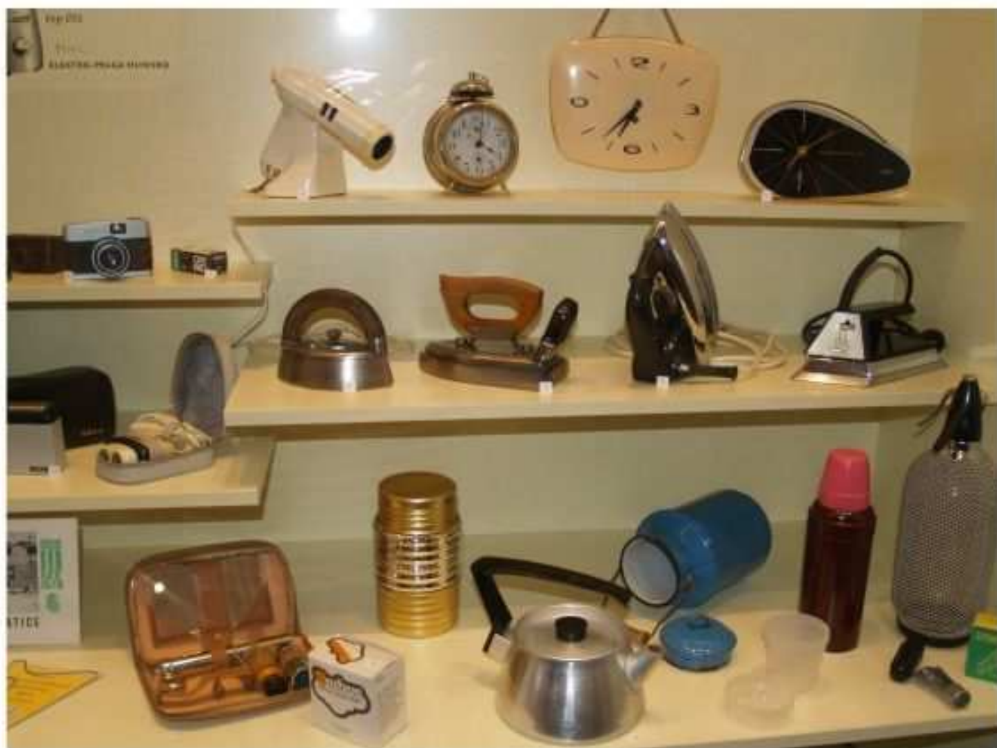
Retro domácnost - poklady, které možná ještě máte doma

V první části je řada artefaktů prachatické proveniencí (obraz Literátského bratrstva, bočnice renesančních lavic z kostela sv. Jakuba, terče prachatických ostroštelců), nechybí figurální výjev Vypláčení žoldu Pasovským Petrem Vokem. Zaujmou i předměty zapůjčené z Vyšehradské kapituly, která byla prvním majitelem Prachatic.