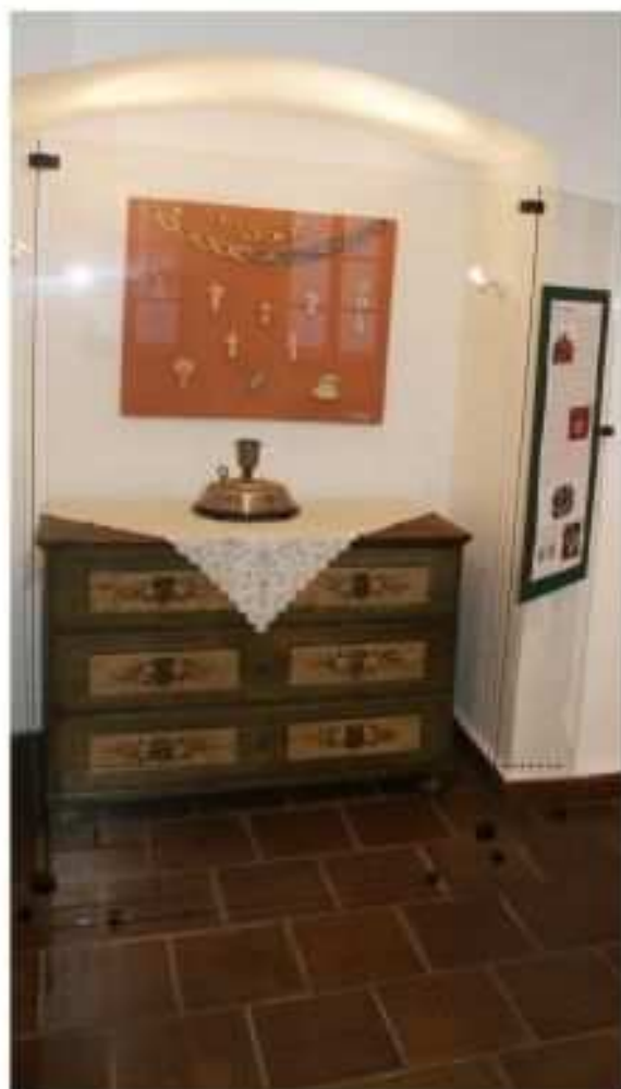
Perla v podobě hracího stojánku firmy J. C. Eckhardta

Opomíjený symbol Vánoc. To je název vánoční výstavy Prachatického muzea, která by ráda alespoň nahlédla do stoleté historie vánočních stojánků. Uvidíte, z jakých materiálů se stojánky vyráběly, jaké mohly mít barvy, jaké tvary. Budete moci obdivovat i takovou sběratelskou lahůdku, jakou je mechanický hrací stojánek z počátku století, který nám laskavě zapůjčilo Západočeské muzeum v Plzni. Nebo se pobavíte pohledem na trpaslíky odpočívající u muchomůrky, neboť i to je jedna z podob vánočních stojánků 20. století. Možná z nich na Vás dýchne vůně dětství, a když ne, určitě Vás ovane alespoň vůně Vánoc.